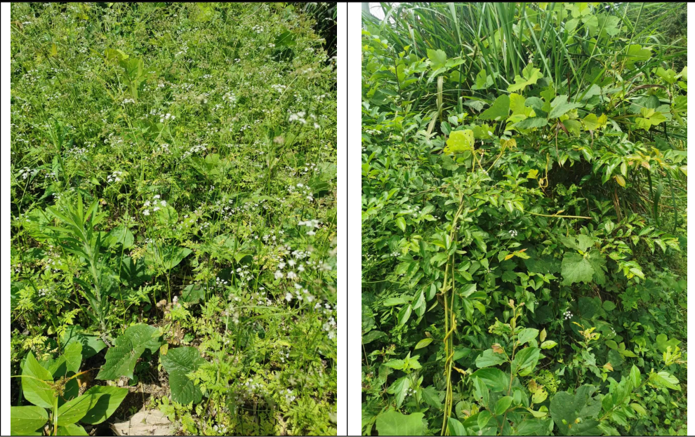
图 3-2 项目周边生态现状

与项目有关的原有环境污染和生态破坏问题 根据评价期间现场勘查，现有工程存在环境问题及整改措施如表 3-2。